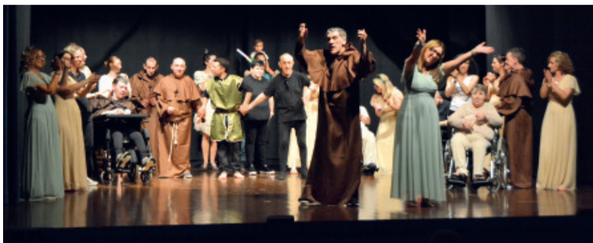
Forti emozioni per lo spettacolo teatrale