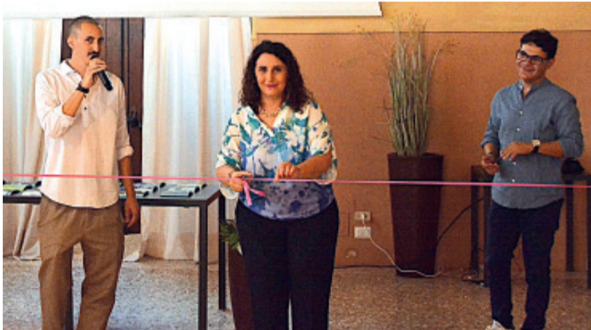
L'inaugurazione delle mostra