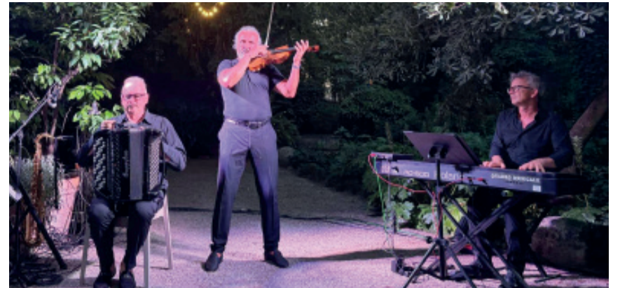
Musica al Parco Terzi

Successo al Parco Terzi della cittadina del Chiese per una serata tra musica, natura e suggestioni per celebrare il solstizio d'estate. Una notte speciale immersa nella magia del Parco Terzi dove Comune e Pro Loco hanno presentato "Note per Sognare", un evento che ha unito arte, paesaggio e convivialità in uno degli angoli più affascinanti di Asola. La serata