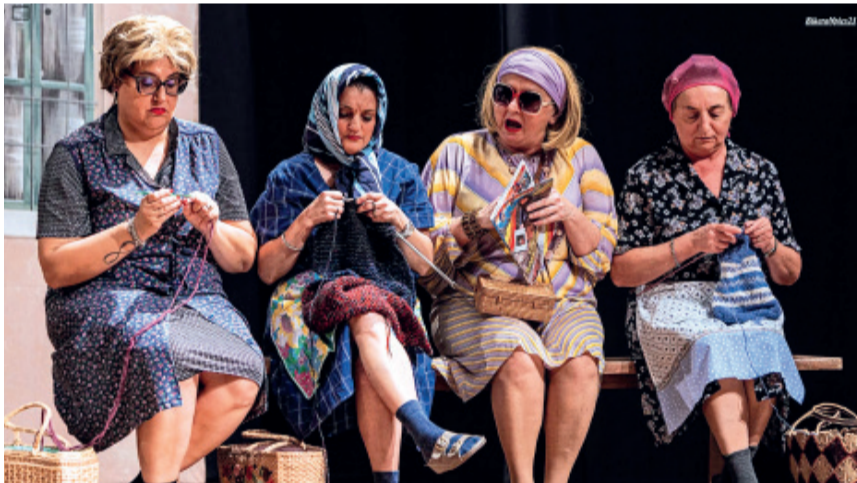
Una scena di uno spettacolo dell'Instabile