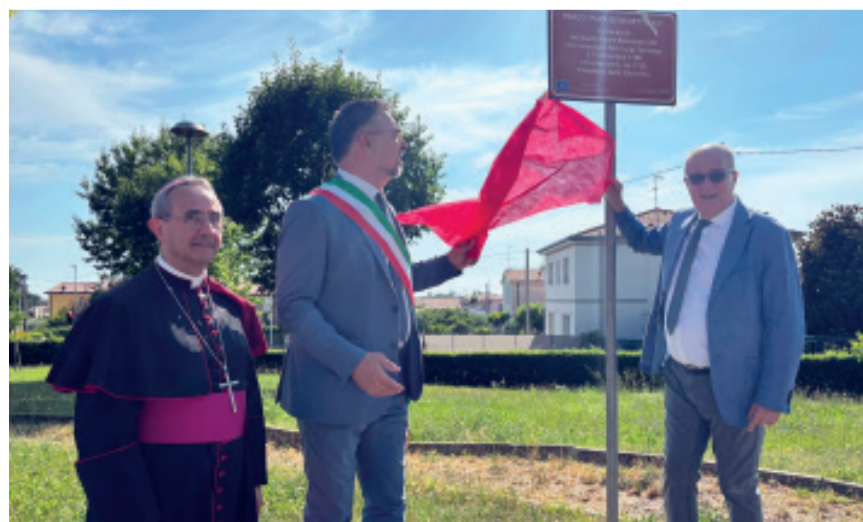
Busca, Volpi e Finadri scoprono la targa

giunto il vescovo di Mantova, facendo riferimento alla vicina sede della cooperativa Fiordaliso. Proprio ai ragazzi seguiti da Fiordaliso sarà affidata la manutenzione del parco di via Groppi. Il quale, lo ricordiamo, fu allestito da Comune con un contributo ottenuto grazie ad un concorso di disegno vinto dallo studente castiglione Dario Colaci nel 2015. Si è quindi passati al scoprimento del cartello che recita: "In memoria del Santo Padre Benedetto XIII che canonizzò San Luigi Gonzaga il 31 dicembre 1726 e lo proclamò, nel 1729, Patrono della Gioventù". (e.b.)