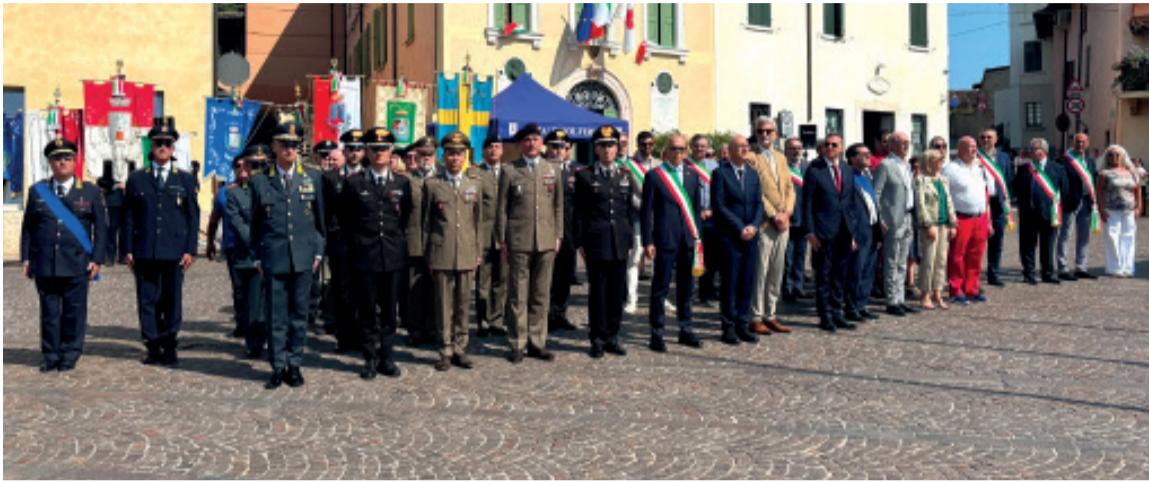
Autorità civili e militari in piazza Torelli