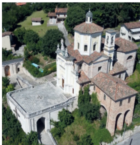
Il Santuario di Carpenedolo

Ci sono luoghi che, senza fare rumore, accompagnano la vita di un paese. Luoghi dove si entra per una preghiera, per accendere una candela, per affidare una gioia o una preoccupazione. Per tanti carpenedolesi il Santuario della Madonna del Castello è proprio questo: una presenza discreta, ma profondamente cara. Forse è anche per questo che la candidatura al censimento FAI "I Luoghi del Cuore" sta suscitando una partecipazione così bella. Non è soltanto una raccolta firme per ottenere risorse destinate a salvaguardare affreschi, tele e stucchi segnati dall'umidità e dal tempo. È l'occasione per riscoprire un luogo che custodisce la memoria, la fede e l'identità della nostra comunità. L'iniziativa è nata grazie ad alcune persone del paese, profondamente legate al Santuario, che hanno visto nella proposta del FAI una concreta opportunità. Attorno a questa intuizione si sono raccolte la Parrocchia, il Comune di Carpenedolo, la Pro Loco, l'Associazione Museo Simone Butti, numerose associazioni e tanti volontari. Sono nati così i banchetti all'uscita delle Messe e durante le manifestazioni del paese. Anche i social e le pagine Facebook locali