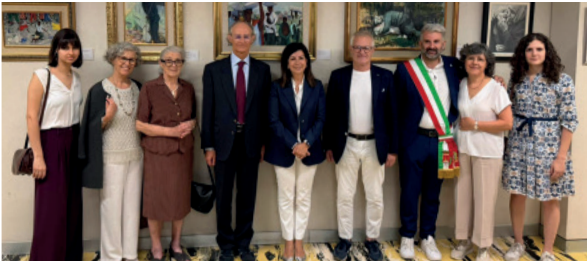
Il vernissage della mostra con famigliari e autorità

Si chiude oggi a Palazzo Pirelli di Milano la mostra "Uno sguardo pittorico sull'uomo" dedicata alle opere di Aldo Biancardi, medico e artista montecelarese conosciuto con il nome d'arte Giacinto, scomparso nel 2024. L'esposizione, ospitata negli spazi del Consiglio Regionale, ha proposto un percorso attraverso venti opere che hanno raccontato la sensibilità umana, sociale e spirituale dell'autore, offrendo ai visitatori una riflessione sui gran-