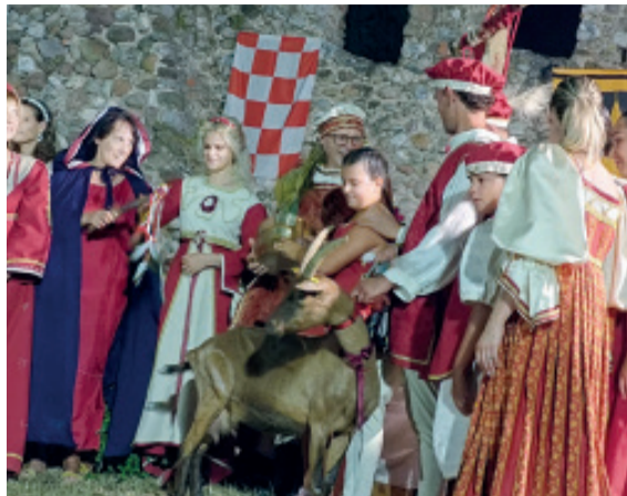
La Contrada Castello vincitrice di questa edizione

ha riconosciuto il valore; il Comitato del Palio per il fondamentale supporto, e inoltre tutte le associazioni: l'associazione culturale Cavriana, la compagnia teatrale El Vultu, la banda musicale, gli sbandieratori di Isabella d'Este e il gruppo commercianti. Un ringraziamento speciale va alla presidente del Comitato Palio Nazionale Vicari".