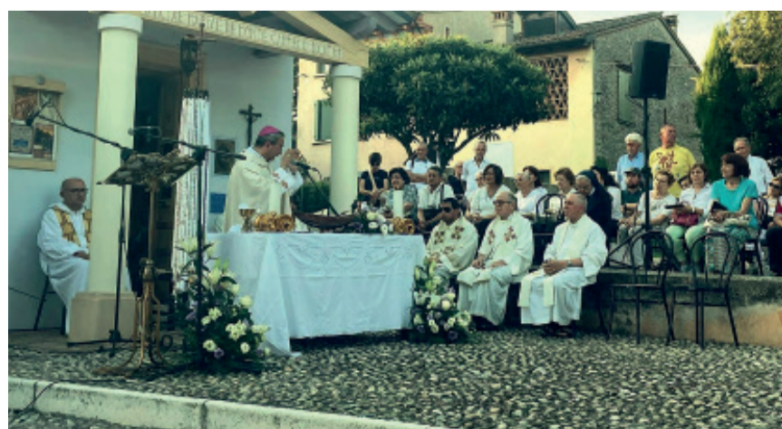
Una precedente edizione