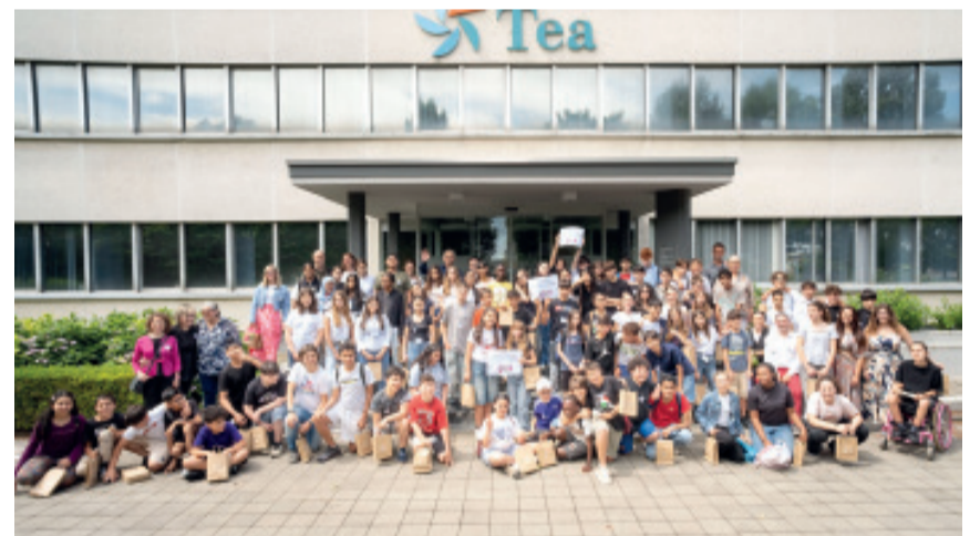
I vincitori di 'Diventa Inventore'

Si è chiusa alcuni giorni fa, con la premiazione dei vincitori, la settima edizione del concorso di educazione ambientale 'Diventa Inventore' organizzato da Mantova Ambiente che quest'anno proponeva il tema 'Che ci faccio con questo?'. Il concorso, riservato alle scuole secondarie di primo grado, intendeva sollecita-