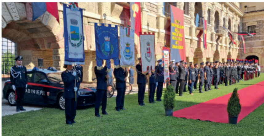
I labari dei 4 comuni ove operano le caserme principali del mantovano

Nell'affascinante cornice del Cortile della Cavallerizza di Palazzo Ducale a Mantova si è svolta, la cerimonia per il 212° anno di fondazione dell'Arma dei Carabinieri. Oltre all'impegno prevalente dei Carabinieri sul fronte sia dell'ordine e della sicurezza pubblica sia della polizia giudiziaria, vanno in particolare modo aggiunti quelli prettamente militari, tra cui la partecipazione a numerose missioni all'estero per il mantenimento della pace, e, sotto l'egida dell'Onu, ai programmi di assistenza per la costituzione delle Istituzioni Civili di alcuni Paesi "fuori area". La repressione della criminalità, la lotta al terrorismo, così come la diuturna attività in difesa della sicurezza dei cittadini e della legalità, contro ogni forma di violazione, sono i principali capitoli dell'impegno i-