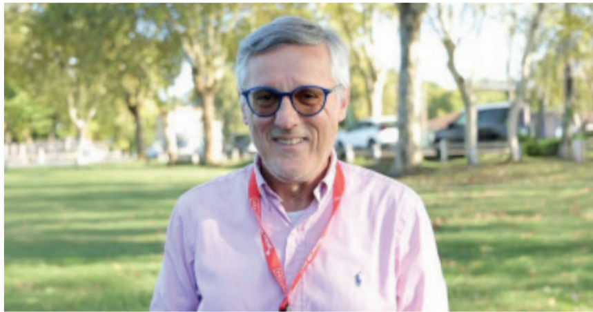
Valerio Varesi presenterà a Montichiari la sua nuova storia

Le nebbie di un autunno inoltrato regalano alla città di Parma un'atmosfera ovattata, irrealistica, ricca di suggestioni e fantasie. Ed è proprio in questo clima che si deve muovere Franco Soneri, l'immarcescibile commissario di polizia della Questura del capoluogo ducale, chiamato a sbrogliare la matassa di un caso in cui politica, estremismi, affari più o meno sporchi, commercio delle armi, vecchie e nuove generazioni a confronto alimentano una miscela pericolosa ed esplosiva. A quasi trent'anni dalla "creazione" del suo protagonista, lo scrittore noir Valerio Varesi propone la diciottesima storia di una vera e propria saga che nel corso del tempo ha aumentato lettori e consensi ponendosi sulla scia dei grandi autori d'oltralpe tanto da essere soprannominato il "Simenon italiano".