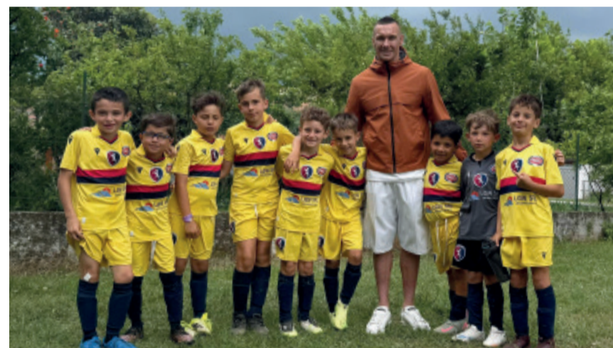
I classe 2018 dell'Fc Castiglione con il portiere del Bologna Skorupski