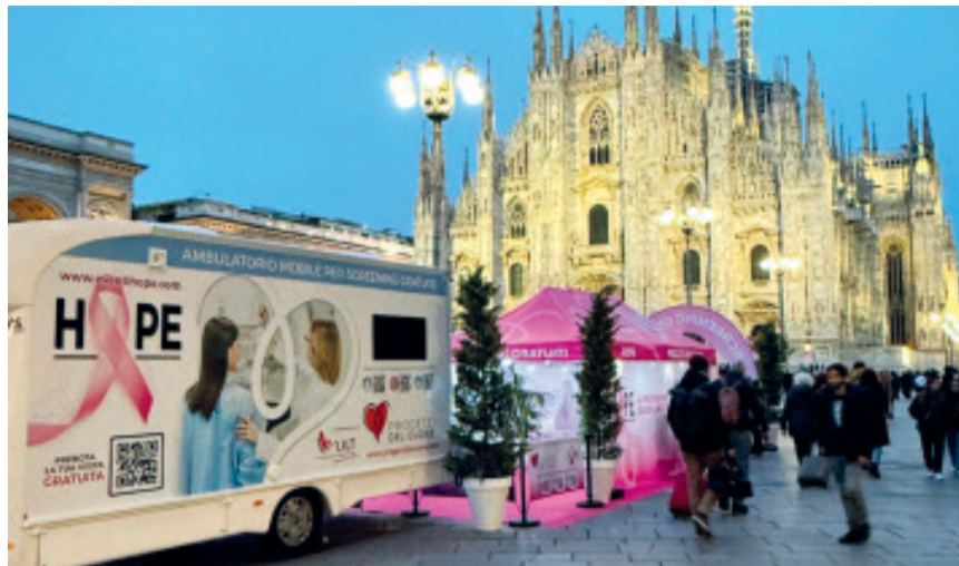
Una recente iniziativa dei "Progetti del Cuore"

La città di Castiglione delle Stiviere sarà al centro di una giornata dedicata alla prevenzione sanitaria, tema che dovrebbe stare a cuore a ogni età. Sabato 13 giugno dalle 9 alle 18 in Piazzale Tozza e in