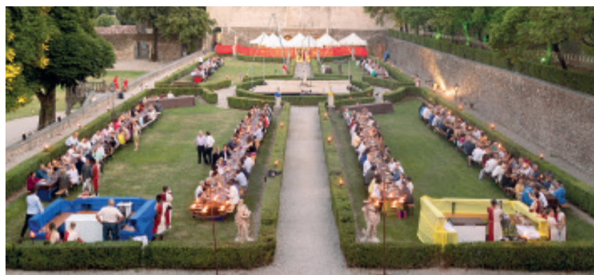
Una passata edizione

Si sono appena spente su 'Novecento' e le luci si riaccendono subito a Volta Mantovana con il grande spettacolo del 'Convivium voluptatis' nei prossimi 20 e 21 giugno. La suggestiva cena-spettacolo sabato 20 nei giardini di Palazzo Gonzaga tra giullari, mangiafuoco e nobili signori, una cena indimenticabile che si tuffa direttamente nei fasti del Rinascimento. E domenica 21 'L'arte della commedia, la commedia dell'arte' porterà gli spettatori in un nuovo 'sogno itinerante' ambientato nel Cinquecento con la Compagnia de l'Ordallegri. L'evento è promosso dal Comune di Volta Mantovana e gode del sostegno di sponsor accanto ad enti quali Pro Loco voltese, Associazione Colline Moreniche, Gruppo Tea. Una due giorni di magico