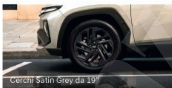
Cerchi Satin Grey da 19"

SCOPRILA NELLA NOSTRA NUOVA SEDE A LONATO DEL GARDA.