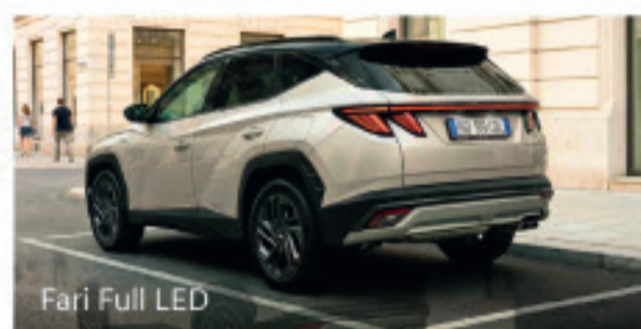
Fari Full LED