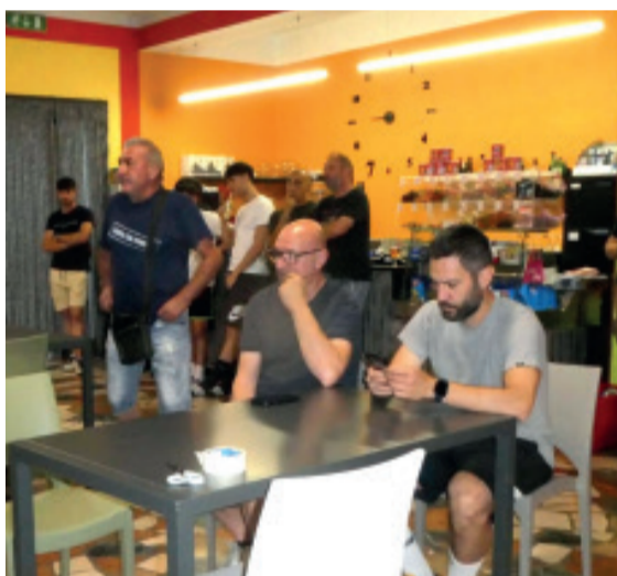
La serata dei sorteggi