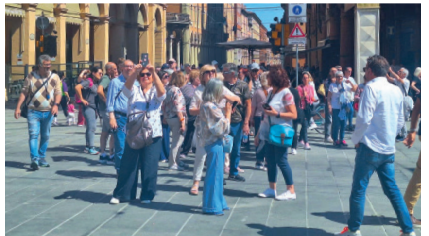
Cittadini guidizzolesi in centro a Bologna

In 50 hanno preso parte alla gita Bologna organizzata dalla Pro Loco di Guidizzolo, casualmente proprio il giorno in cui nel capoluogo dell'Emilia Romagna si svolgeva la 'Strabologna', camminata ludico motoria non competitiva che ha visto la partecipazione di circa 22.000 persone. I guidizzolesi, tra loro anche partecipanti di centri limitrofi, hanno così dovuto fare i conti con questa variegata e straordinaria mole di camminatori che invadono la cit-