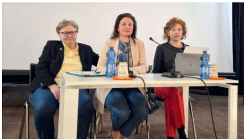
La presentazione di LuniCa

Si chiama la nuova libera università di Calcinato, "LUniCa", ed è un progetto culturale e formativo promosso dall'assessorato alla Cultura con l'obiettivo di offrire un'opportunità di educazione permanente aperta alla cit-