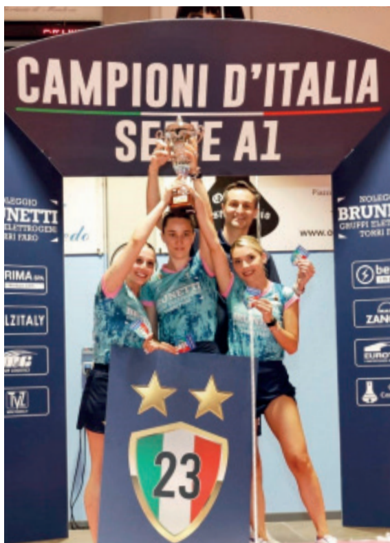
Il team femminile di A1 con lo scudetto