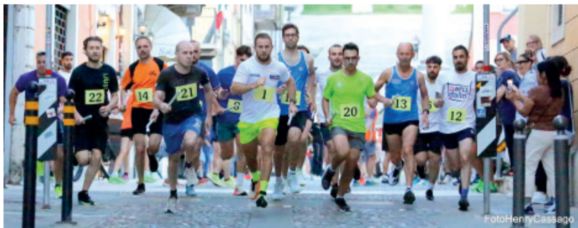
Un momento della Staffetta delle due piazze

Fine settimana intenso per i Podisti Castiglionesi, in occasione della Festa dello Sport. È stata, infatti, riproposta la Staffetta delle due piazze, con formula non competitiva, mitica manifestazione che aveva avuto la sua ultima edizione nel lontano 2012. Il percorso era di 800 metri, che ogni frazionista ha dovuto percorrere partendo da piazza Ugo Dallò, percorrendo