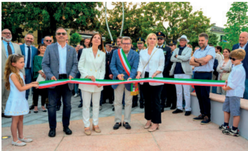
L'inaugurazione con le autorità

E' stato inaugurato il nuovo tratto della passeggiata a lago di Desenzano del Garda, ultimo lotto del più ampio progetto di riqualificazione del lungolago sul versante nord-ovest della città, nel tratto compreso tra via Gramsci e vicolo delle Lavandaie. L'intervento, realizzato grazie alla collaborazione tra Comune, Regione e Autorità di Bacino Laghi Garda e Idro, ha comportato un investimento complessivo di 3 milioni e 140 mila euro. Con questo terzo e ultimo stralcio si è completato un progetto strategico e fortemente atteso. La nuova passeggiata si sviluppa per circa 200 metri e si caratterizza per una larghezza costante di 9 metri, affacciandosi direttamente sull'acqua con un profilo che richiama il naturale movimento del lago. Accanto al percorso pedonale è stata realizzata una fascia verde di interposizione larga da 2 a 4 metri, studiata per separare la passeggiata dalla viabilità e aumentare il comfort ambientale. Particolare attenzione