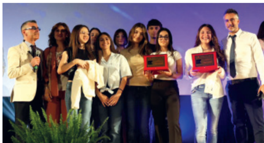
La premiazione degli studenti di Montichiari

Il cortometraggio "I was" realizzato dagli studenti degli istituti comprensivi statali "Ferrari" e "Montalcini" e del "Don Milani" di Montichiari si è aggiudicato a Giffoni Valle Piana l'ottava edizione della manifestazione cinematografica per le scuole denominata "Legalità in corto". Concepita nell'ambito del progetto di "Educazione alla legalità, sicurezza e giustizia sociale" organizzata dall'ex giudice Sante Massimo Lamonaca per i ragazzi delle scuole secondarie di primo e secondo grado montclarensi e diretta dal regista Luca Moltisanti insieme con le sceneggiatrici Rossella Corrado e Fenisia Tomada, la pellicola, patrocinata dal Comune e sostenuta da diversi sponsor del territorio, ha portato sul palcoscenico anche le compagnie tea-