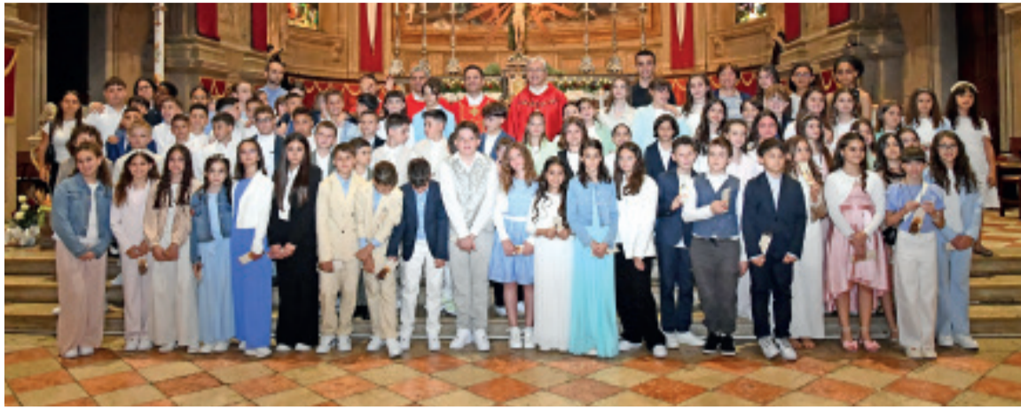
Ragazze e ragazzi che hanno ricevuto Cresima e Prima Comunione