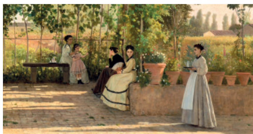
La locandina della mostra

La mostra I Macchiaioli a Palazzo Reale è un'importante occasione per comprendere la centralità di questo movimento all'interno della storia della pittura italiana dell'Ottocento. Le opere esposte dimostrano, infatti, come la "macchia" non sia un mero espediente tecnico per questi pittori, ma un principio strutturale che nasce dall'osservazione diretta e senza filtri della realtà e dalla volontà di restituirne l'immediatezza data dallo sguardo. Giovanni Fattori, figura cardine del percorso e del movimento macchiaiolo, è rappre-