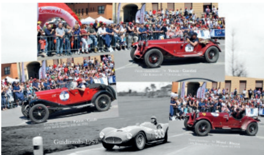
Alcune delle immagini in mostra