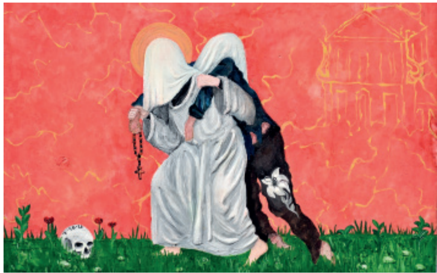
'Immedesimazione', opera vincitrice

Negli scorsi giorni presso il Fedecommissario Aloisiano si è riunita la giuria del concorso artistico 'Luigi tra noi' per procedere alla selezione delle opere presentate dai giovani artisti del liceo 'Alessandro dal Prato' di Guidizzolo sul te-