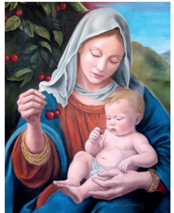
La "Madonna delle ciliegie"