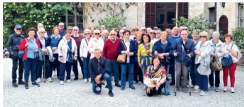
Gli “Amici dei Viaggi” di Carpenedolo