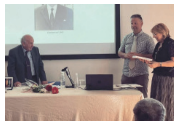
La presentazione del libro