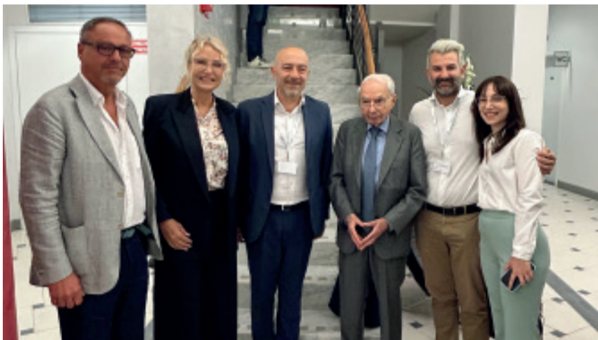
Le autorità presenti

i più importanti imprenditori tessili d’Italia, il ruolo della scuola in un’epoca di trasformazioni tecnologiche, il rapporto tra il sapere delle enciclopedie, con alcuni dati sulla “Treccani” consultabile oggi gratuitamente in versione digitale, e l’intelligenza artificiale, la dialettica conoscenza-potere, i cambiamenti intercorsi nel Novecento. Sul palco sono state portate in esposizione l’edizione originale dell’Enciclopedia Treccani donata dal conte alla comunità e la rara riproduzione anastatica della Bibbia di Borso d’Este che Treccani degli Alfieri acquistò per 5 milioni di lire nel 1923 per donarla allo Stato italiano. Allo studio importanti celebrazioni per il 2027 che segnerà il 150° di nascita dell’illustre monteclarense. (fe.mi.)