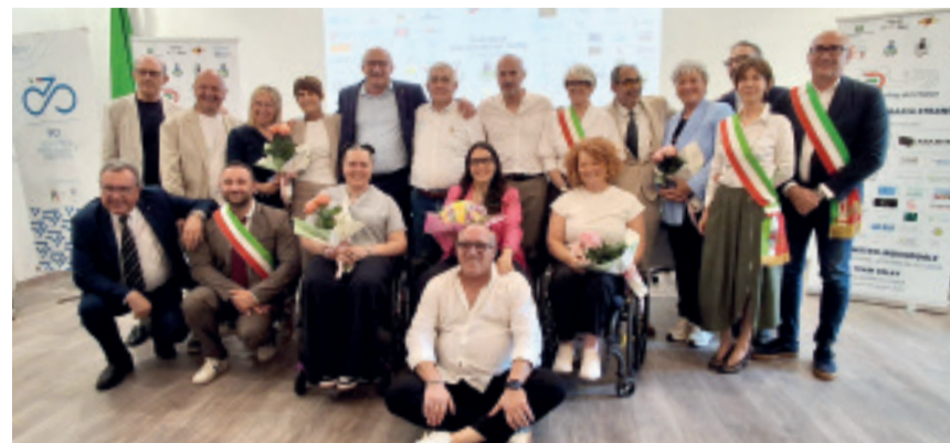
Autorità e organizzatori alla presentazione