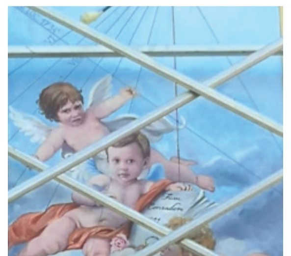
La meridiana in costruzione

È partita la fase di condivisione del progetto 'Quadranti di Gloria' ideato dal Movimento Arte e Pensiero Alessandro Dal Prato, Map AQP, con l'obiettivo di costruire un 'Parco delle meridiane' nella Collina Morenica del Garda. Si tratta, negli intenti e come già anticipato dal nostro giornale, di un vero e proprio progetto culturale a scala territoriale rivolto al 'turismo lento' sul tema del tempo e del ritmo della Natura. Un progetto pionieristico che intende offrire all'avvenire turistico non solamente bellezze da vedere ma anche bellezze da pensare o per pensare. In questa prima fase il programma parte dalla condivisione degli intenti tra i vari partners, tra i quali spicca l'Associazione Colline Moreniche che ha già manifestato ampio interes-