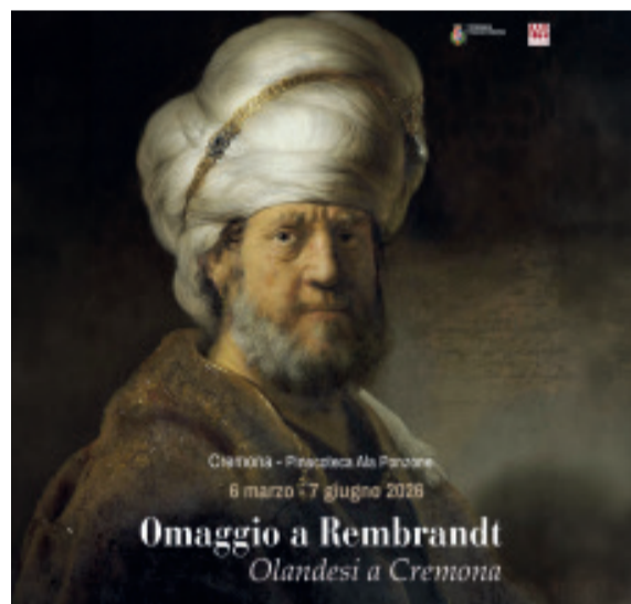
La locandina della mostra

Fino al 7 giugno, la mostra "Omaggio a Rembrandt. Gli Olandesi a Cremona", allestita presso il Museo Civico Ala Ponzone, rappresenta un progetto espositivo di particolare interesse, costruito attorno a un'idea chiara: mettere in relazione un capolavoro di Rembrandt van Rijn con il contesto più ampio della pittura nordica del XVII secolo, conservata nelle collezioni cremonesi. Il cuore della mostra è il dipinto "Ritratto di uomo in costume orientale", proveniente dal Rijksmuseum. Si tratta di una tronie, cioè uno studio di espressione e caratteristiche più che un ritratto in senso stretto. La figura, avvolta in abiti esotici e impreziosita da un turbante, emerge da un fondo scuro grazie a una luce calibrata che modella il volto e i tessuti con grande intensità. La mate-