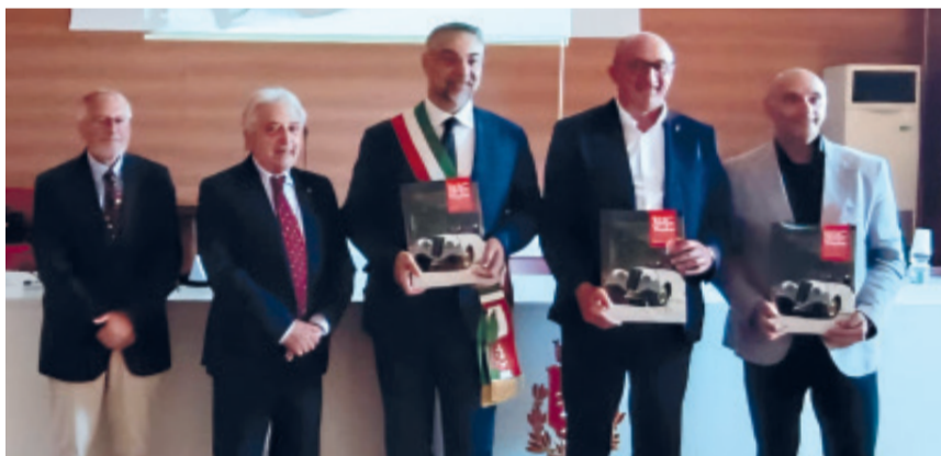
La presentazione dell'iniziativa